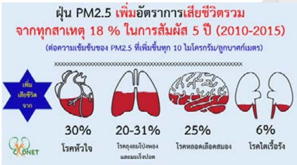
ภาพที่ 2 ฝุ่น PM_{2.5} เพิ่มอัตราการเสียชีวิตของโรคต่างๆ

ร้อยละ 31 และโรคไตเรื้อรังร้อยละ 6 ดังภาพที่ 2 โดยอัตราการป่วยและเสียชีวิตจากโรคหลอดเลือดหัวใจและสมอง พบมากที่สุดบริเวณภาคกลางและภาคเหนือตอนล่าง ในขณะที่โรคหลอดเลือดอุดตันเรื้อรังและโรคมะเร็งปอดพบมากที่สุดที่ภาคเหนือ